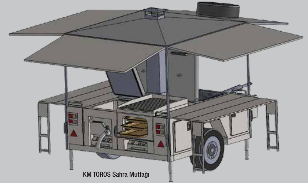
KM TOROS Sahra Mutfağı

Cooking and service in all kinds of conditions.